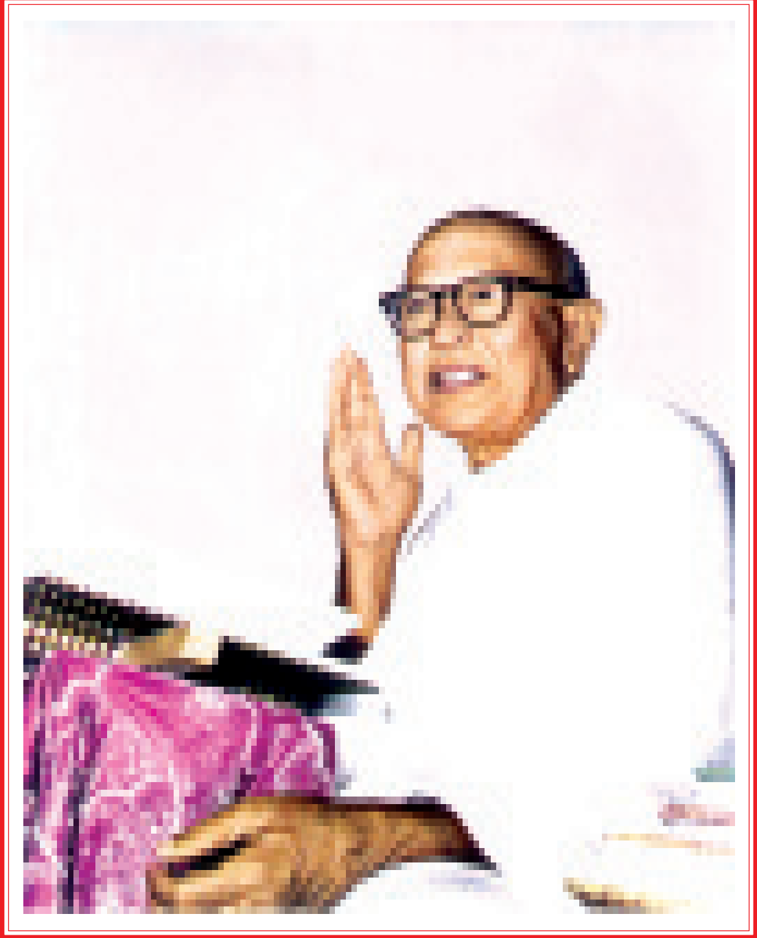
अध्यात्मयुगसर्जक पूज्य सद्गुरुदेवश्री कानजीस्वामी